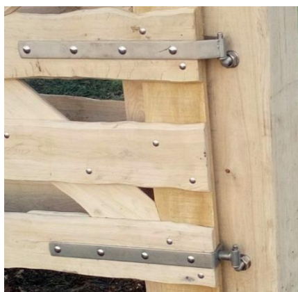
Zwaar verstelbaar RVS