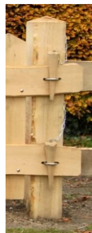
of een eiken slotklos