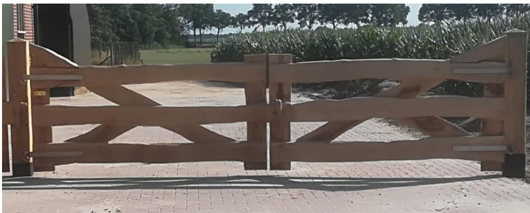
Zwaar eiken toegangshek onbekant met 2, 3 of 4 eiken planken