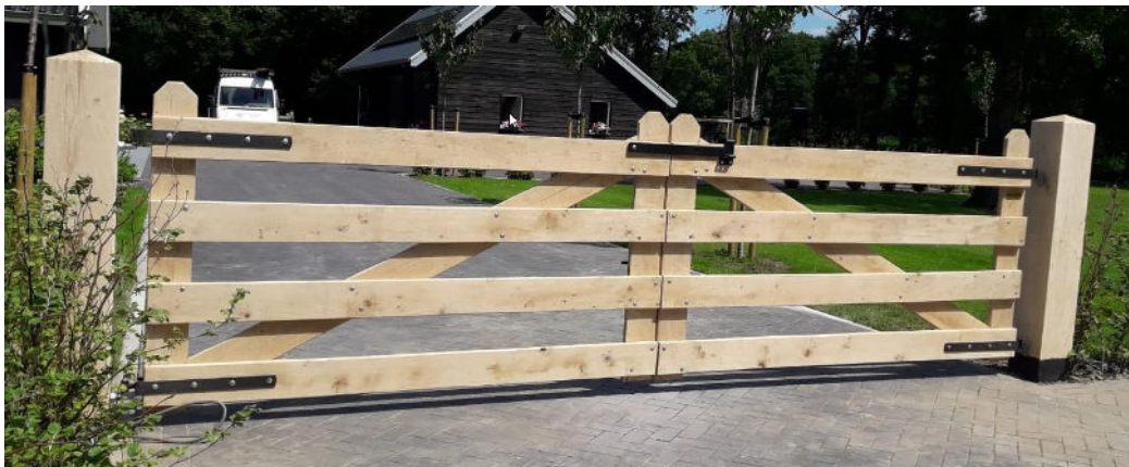
Zwaar luxe eiken