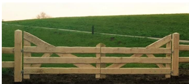
Onbekante eiken planken 500 cm doorgang