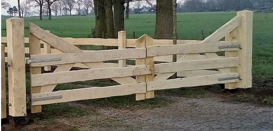
Zwaar eiken toegangshek met hoge punt, onbekant met 2, 3 of 4 eiken planken