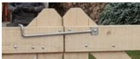
met een RVS overslag