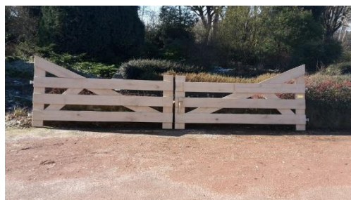
Strak bezaagde planken